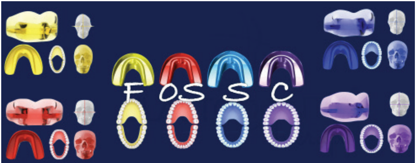
Descripción de los dispositivos de Clase I según la forma de la arcada del paciente Esquema del Dr. Filippo Cardarelli