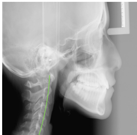
Noviembre de 2020 - Post tratamiento

La maloclusión se caracteriza por la contracción del maxilar superior con un espacio reducido para la erupción de los dientes permanentes. La secuencia terapéutica comprende los siguientes pasos