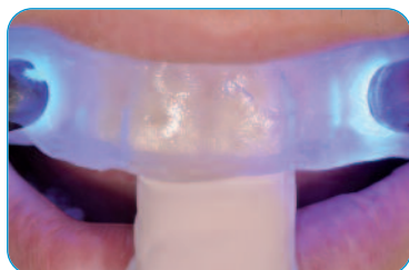
Fotopolimerización (60 seg)