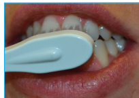
Cepillar nuevamente durante otros 30 segundos y enjuagar cuidadosamente.