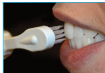
El paciente tiene que cepillar los dientes a blanquear durante unos 30 segundos en sentido horizontal y rotatorio evitando las encías