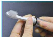
Volver a poner la cabeza del cepillo