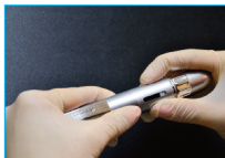
Remover el tapón del cepillo

Informar al paciente de que las coronas y las restauraciones existentes no se blanquean aunque los dientes naturales blanqueen potencialmente. ENA® WHITE 2.0 es proveído en un cepillo con dispensador que contiene 6 ml de producto. El cepillo es desechable: una vez terminado el material blanqueante se tiene que tirar, y el paciente tiene que recibir instrucciones sobre la disposición del cepillo cuando ha terminado el tratamiento, como está indicado en las instrucciones del paciente. Si el producto vence antes del uso, tiene que ser eliminado como residuo peligroso. No exponer a fuentes de calor y luz solar directa. El material tiene que ser conservado en la nevera, a una temperatura de 2°C-8°C. Informar al paciente sobre la necesidad de mantener el producto alejado de fuentes de calor y luz solar directa y de conservarlo en la nevera, aunque sea posible almacenarlo también a temperatura ambiente (20°C) por 2-3 semanas. Si se interrumpe el tratamiento poner el producto en la nevera. ENA® WHITE 2.0 contiene peróxido de hidrógeno; la ingestión de grandes cantidades de producto puede resultar perjudicial. El sistema de aplicación innovador, con un cepillo diseñado para optimizar y acelerar el tratamiento evita que el paciente ingiera grandes cantidades de gel. Explicar al paciente que no debe tragar el gel ni los enjuagues y posteriormente enjuagarse cuidadosamente los labios y todo su contorno después de la utilización.