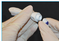
Eliminar el sello