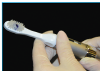
Rotar en sentido antihorario el anillo en la dirección "UP" hasta que el gel salga del orificio entre las cerdas. Es necesaria una cantidad de gel equivalente a una pequeña lenteja