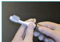
Desatornillar la cabeza del cepillo y removerla del dispensador